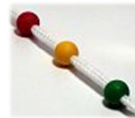
CORDÓN DE BROCH